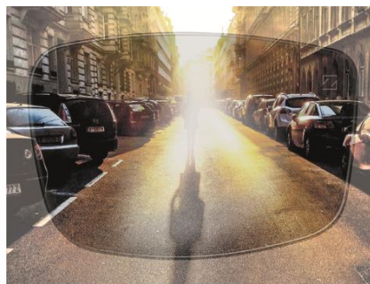
Mit herkömmlicher Sonnenbrille

Für Situationen mit grellem Sonnenlicht und starken Reflexen sind zum Schutz gegen Blendung ZEISS AdaptiveSun Brillengläser auch mit zusätzlichem Polarisationsfilter erhältlich. Natürlich immer mit vollem UV Schutz.